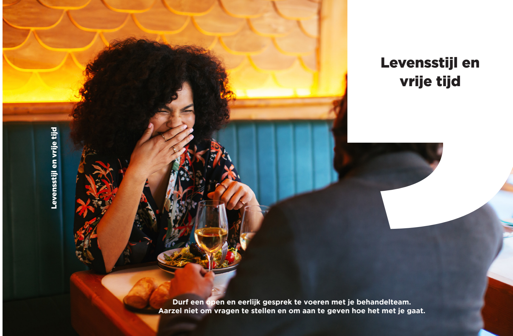
Levensstijl en vrije tijd

Kijk ook op www.crohn-colitis.nl voor meer informatie over deze onderwerpen.